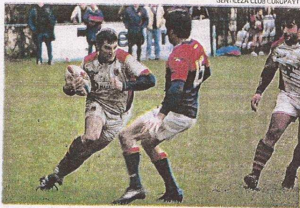
ENCARANDO. LA POTENCIA ES UNA DE LAS VIRTUDES DE SU JUEGO.

Curupaytí en esta Reubicación se dio en la quinta fecha cuando venció como visitante a Pueyrredón, actual puntero del certamen y que hasta el momento sólo perdió ese único encuentro. "Nos salió todo bien y fue un envión anímico para darnos cuenta que podemos. Creo que hoy por hoy la principal arma